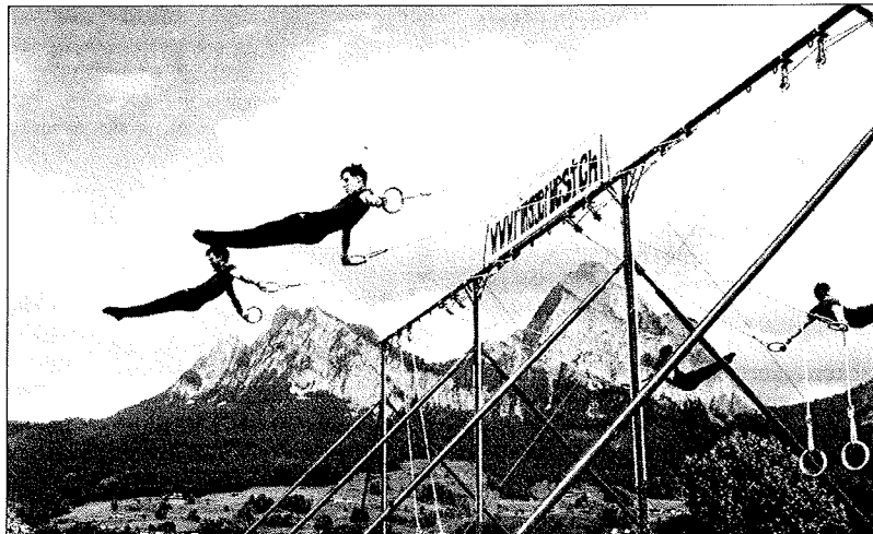
Die gelungene Darbietung an den Schaukelringen wurde mit der Note 9,63 belohnt.