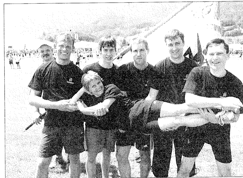
Der Turnverein Schattdorf – ein verschworenes Kollektiv.

auch auf die Schaukelringsparte zutraf. Dort kam der TVS auf 9,63 Zähler. Die Aerobictruppe, dank solider Performance, totalisierte 7,85 Punkte. Insgesamt kamen im Fachtest Allround 8,64 Punkte zusammen. Den